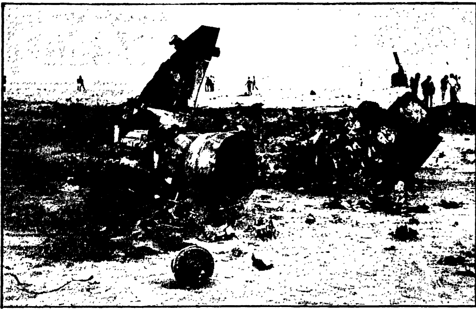
SARDEGNA - Ancora vago e generico l'intervento del presidente Suddu