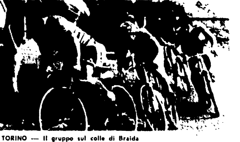
TORINO - Il gruppo sul colle di Braida

La gara di velocità si è svolta a Vallelunga. Pescarolo e Wollek sono stati i primi a completare la gara.