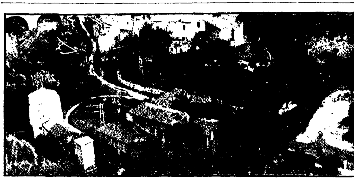
L'ex cartiera vista dall'alto. Sopra il titolo: una cartina del '600 dell'intero complesso

Molto atteso era l'intervento del capogruppo DC Neppi, dopo le ultime vicende maturate all'interno del suo partito. Da un lato Neppi ha precisato i motivi della adesione DC alla Giunta, ma non è stato in grado di presentare con chiarezza la posizione tenuta nelle ultime settimane dal suo partito.