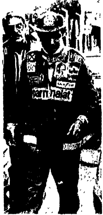
Niki Lauda, una vittoria «trovata»