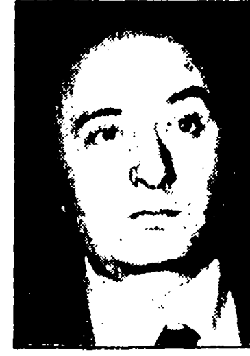
Ciriaco De Mita