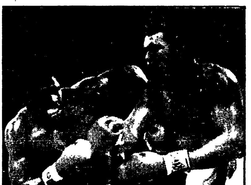
ALI colpisce con un destro SPINKS

Unanime il verdetto dei giudici - Clay è sempre un maestro - Galindez sconfitto