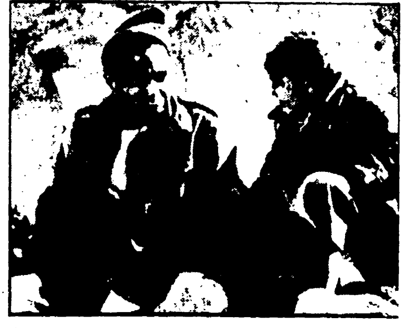
Una scena di « Paisà » di Roberto Rossellini