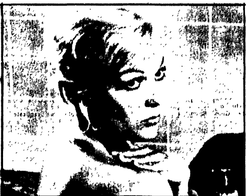
Kim Novak interprete di «Nel mezzo della notte»