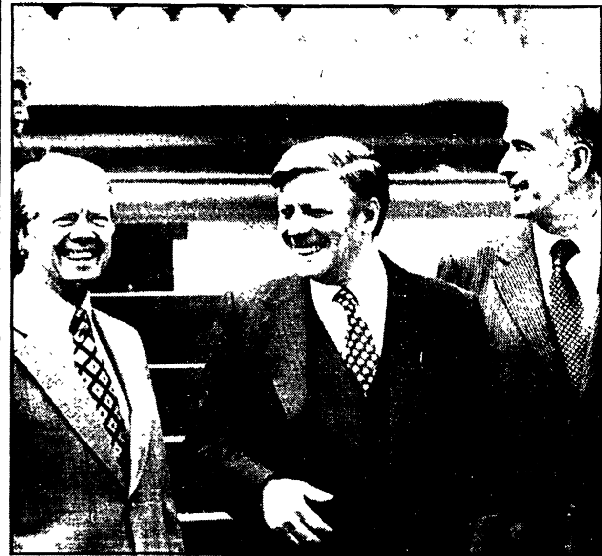
Il cancelliere della RFT Helmut Schmidt (al centro) con il presidente Carter e Valéry Giscard d'Estaing durante una pausa dei lavori del recente vertice economico di Bonn

Dalle polemiche con Brzezinski alle resistenze opposte alle iniziative del presidente Carter, emerge una tendenza del governo della RFT a un impegno più pronunciato sul continente - L'Ostpolitik e le accuse americane di «finlandizzazione»