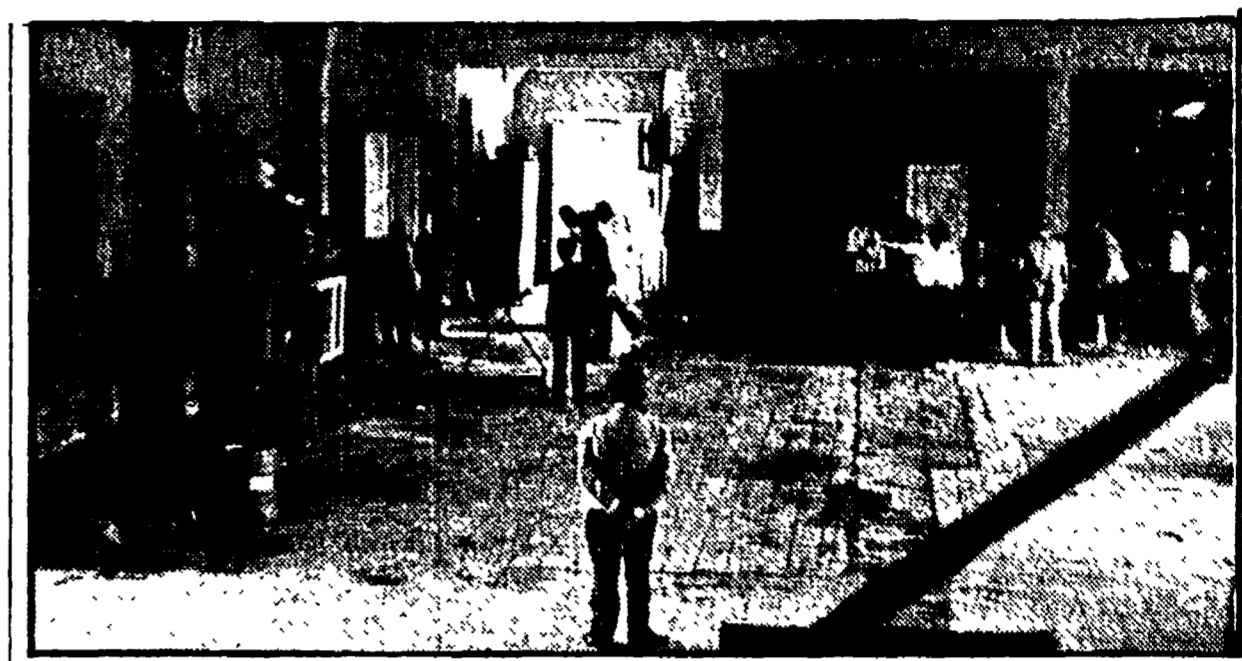
L'interno dello psichiatrico S. Salvi di Firenze

Una legge difficile, nota come la «180» quella che ha cancellato dai nostri vocabolari la parola «manicomio». Una legge «difficile» perché nel paese mancano le strutture adeguate, i meccanismi di attuazione sono ancora in fase di studio. Ed ecco la notizia: in provincia di Firenze la «180» si può applicare. Non solo, ma gli amministratori provinciali pensano addirittura ad un suo superamento, ad integrazioni alle norme nazionali. La rete di servizi sul territorio sta prendendo forma, si stanno legando le ultime maglie: si aspettano alcune firme definitive, il «voto» vero e proprio, ma la Provincia sarebbe in grado di applicare la legge.