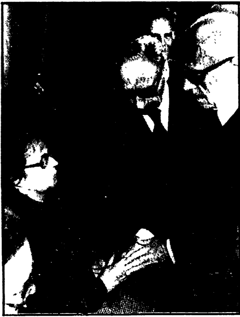
ROMA - Il Presidente della Repubblica Sandro Pertini accanto al procuratore capo De Matteis esprime le condoglianze alla sorella del magistrato ucciso