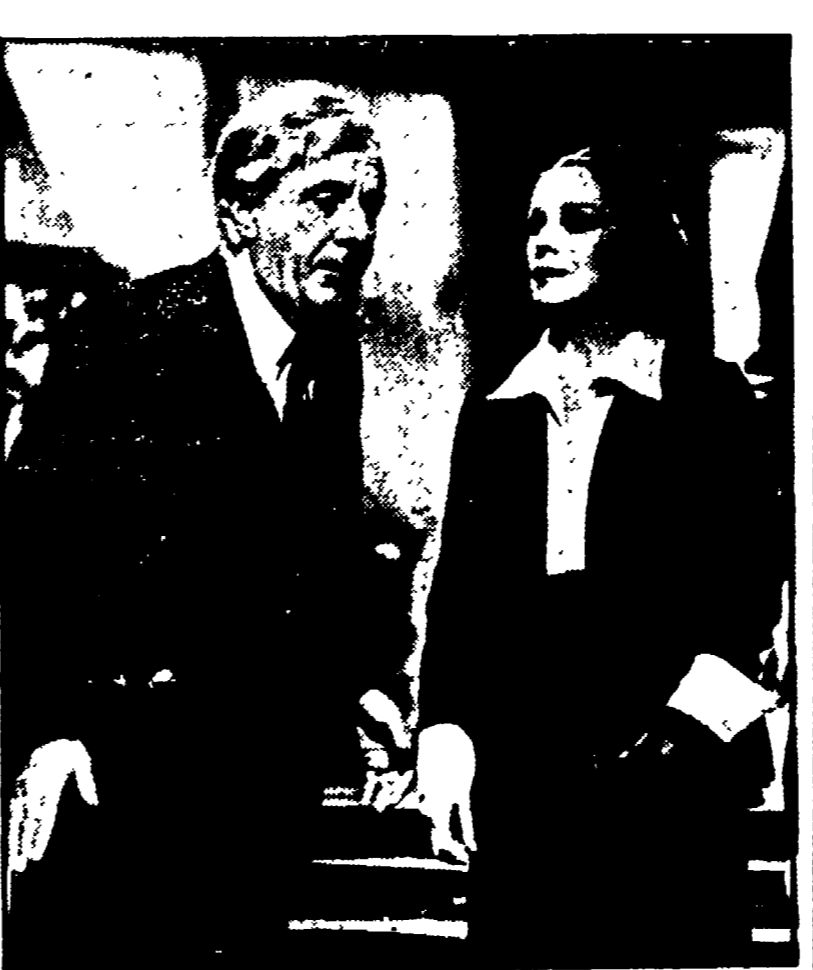
Gianrico Tedeschi e Anna Proclemer nella edizione televisiva de «La governante»