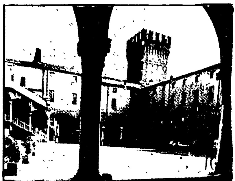
NELLE FOTO: a fianco, la Rocca Stellata di Bondeno; sotto, la piazza municipale di Ferrara