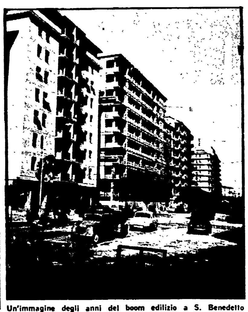
Un'immagine degli anni del boom edilizio a S. Benedetto

I dati della città sono del tutto abnormi - Migliaia di alloggi vuoti e numerose coabitazioni. Le responsabilità della DC. Difficile applicare l'equo canone