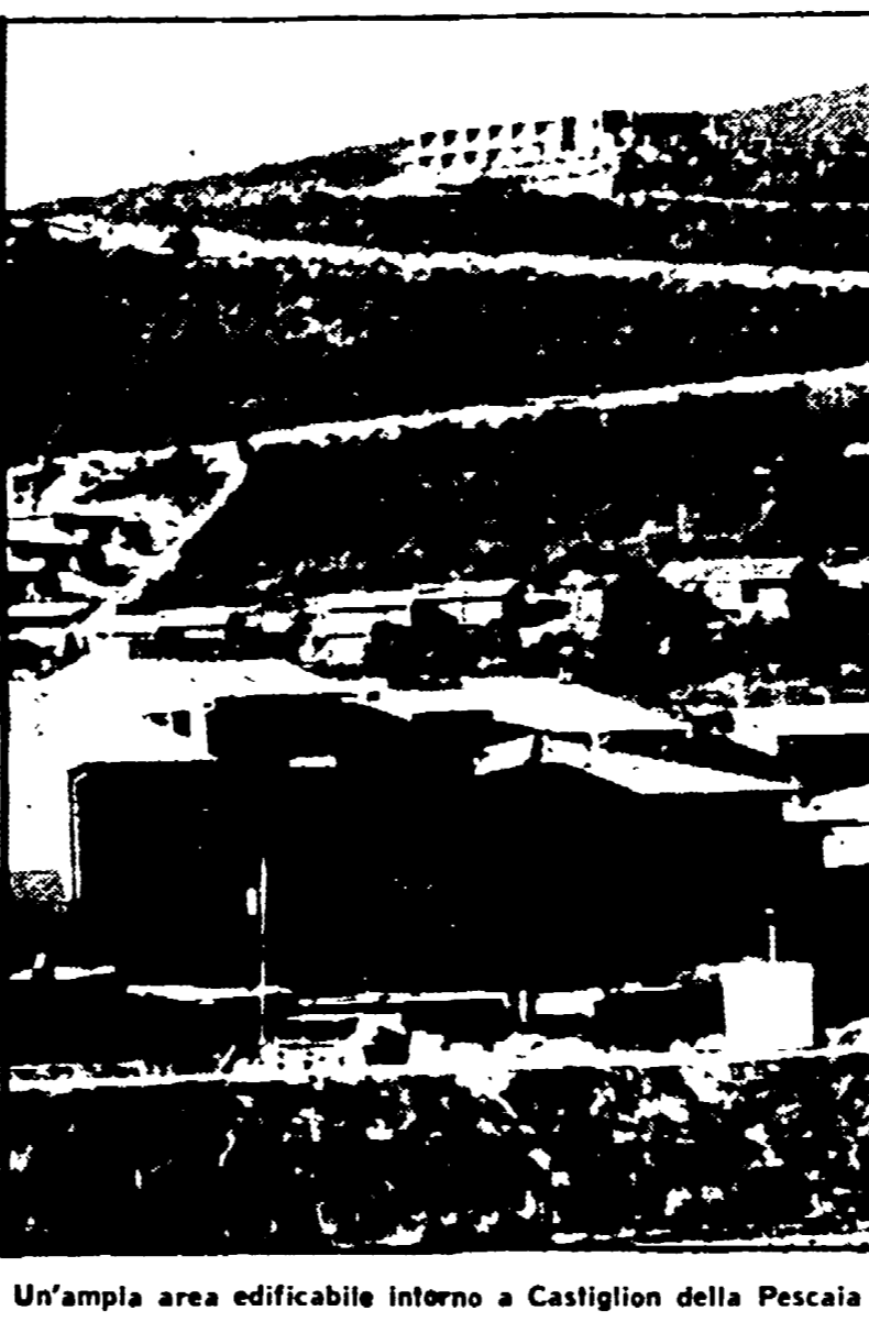
Un'ampia area edificabile intorno a Castiglion della Pescaia

« Aspetti altrettanto significativi nel lavoro di specializzazione sono i corsi di formazione professionale, ai quali è assicurata una partecipazione sempre più numerosa... »