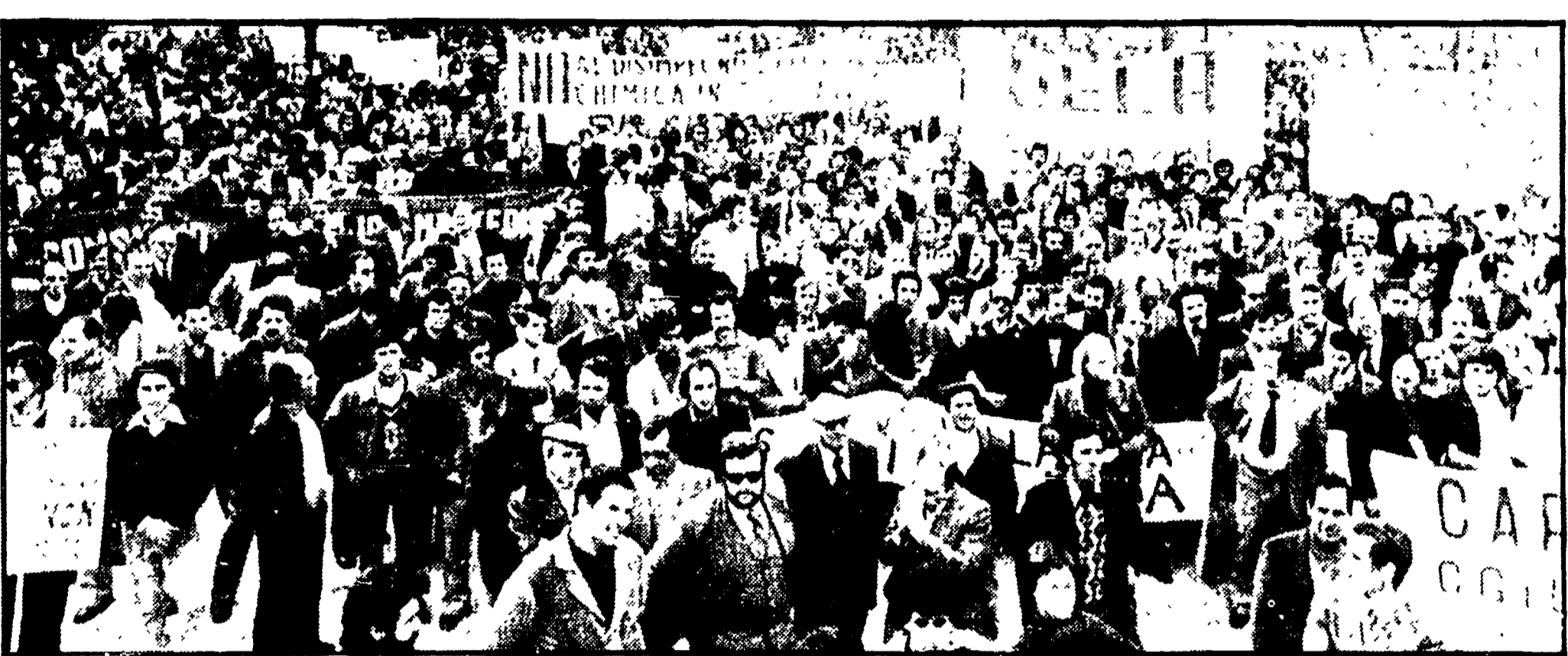
PALERMO — Arriveranno nel primo pomeriggio con pullman (presti in affitto con i frutti di una sottoscrizione popolare e col contributo della associazione di lavoratori dell'Industria dell'Ars) e porteranno nel cuore della città, tutto il peso della dura vertenza che li impegna ormai da 18 mesi.

Si incontreranno con i deputati della commissione parlamentare dell'Industria dell'Ars - Saranno poi ricevuti dal compagno De Pasquale e dal dc Mattarella - Con gli operai delegazioni di Comuni, giovani e sindacati