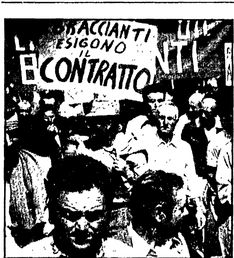
Oggi manifestazione Concoltivatori

Bozza d'intesa sul programma di fine legislatura - Oggi nuova riunione tra le delegazioni per la composizione della nuova giunta