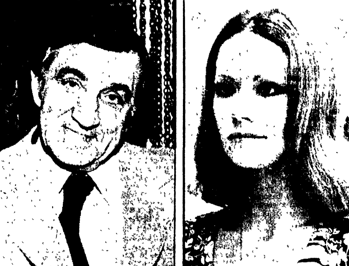
Lino Ventura e Claudine Auger

Il regista Jacques Deray parla del suo ultimo film