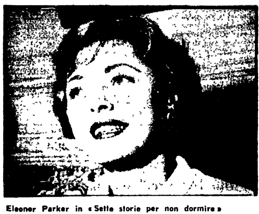
Eleanor Parker in «Sette storie per non dormire»