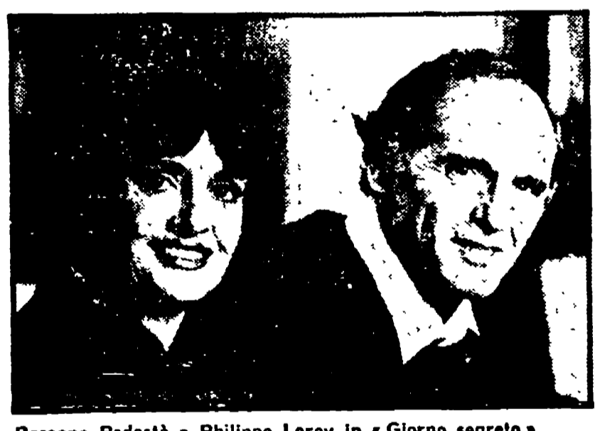
Rossana Podestà e Philippe Leroy in «Giorno segreto»