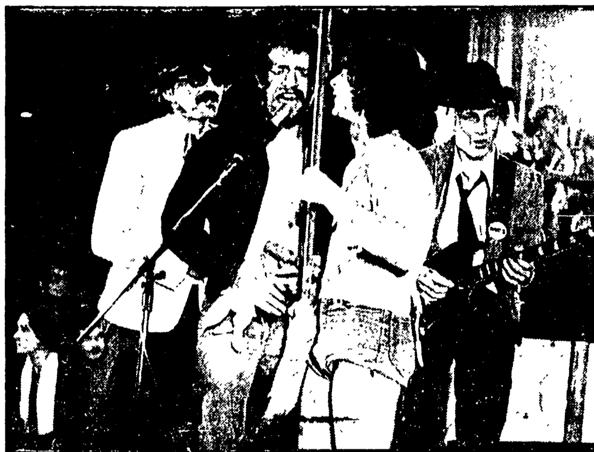
Gli «Skiantos», uno dei complessi che si sono esibiti a Milano

vival. E' con questi modesti auspici che d'altro canto si vorrebbe reinserire il palasport nei circuiti del rock. Anche la notizia della probabile tournée di Patty Smith continua ad alimentare curiosità, aspettative e smanie di organizzazione. L'incalzare della disco-music anche sul piano della musica d'ascolto costringe oltretutto alla difensiva: è indice di questo ripiegamento lo stesso rilancio del rock da parte