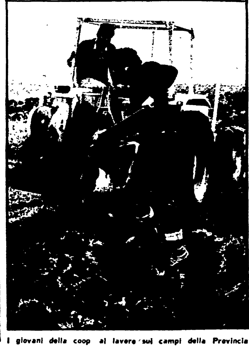
I giovani della coop al lavoro sui campi della Provincia