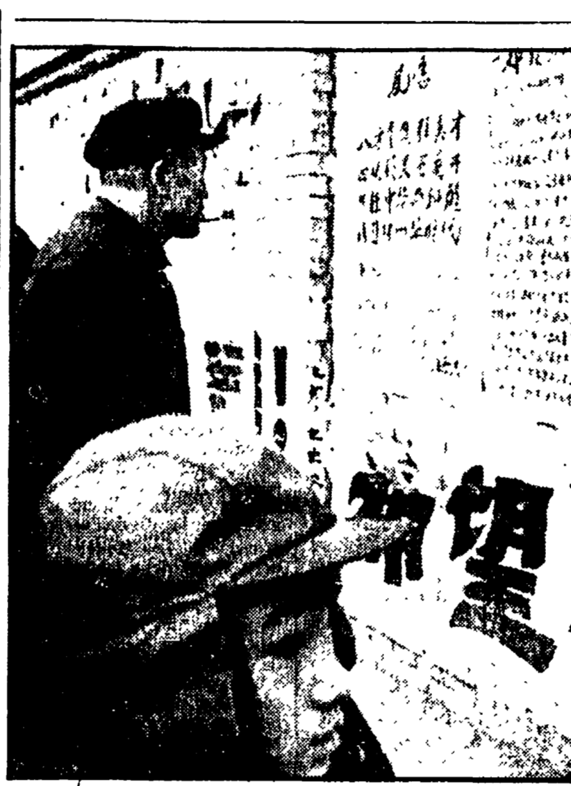
«TAZEBAO» - LETTERA A TITO Sul muro detto «della democrazia» a Pechino (nella foto) è apparsa una lettera aperta a Tito nella quale si afferma che i massimi dirigenti non devono rifugiarsi dall'autocritica.

BRASILIA — Anno nuovo, situazione politica nuova in Brasile. I quasi centoventi milioni di brasiliani guardano con alcune fondate speranze alla prospettiva di una fase di apertura politica, alla conquista di libertà finora riforme politiche (tra cui la possibilità di costituire alcuni partiti e non più l'obbligatorietà del bipartitismo).