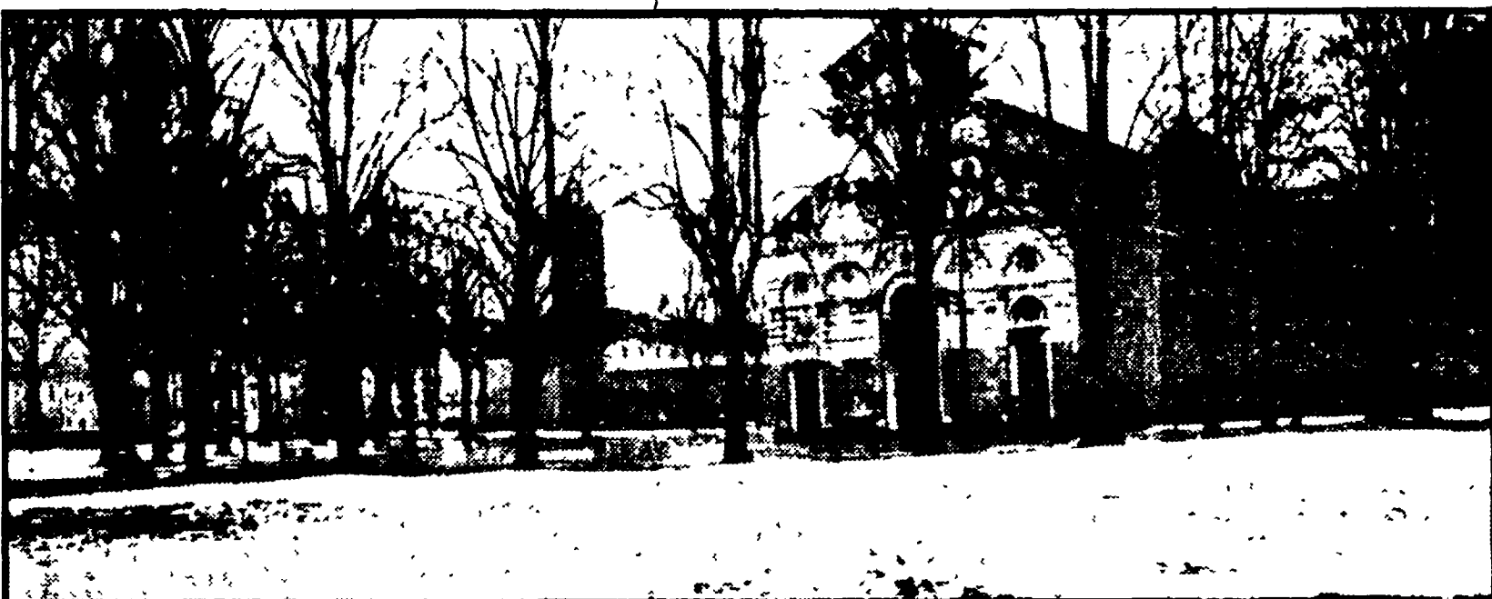
In alto: le banchine del porto di Livorno paralizzate dalla neve. In basso: una delle più belle piazze di Pisa sotto l'inconsueto manto bianco

I meteorologi sono ostinati: le condizioni del tempo non hanno niente di eccezionale, tutto nella norma. Lo dicono le cifre e niente si può obiettare all'evidenza dei numeri: il primo dicembre di cinque anni fa a Firenze nevicò assai di più, una ventina di centimetri rispetto al nemmeno cinque di ieri.