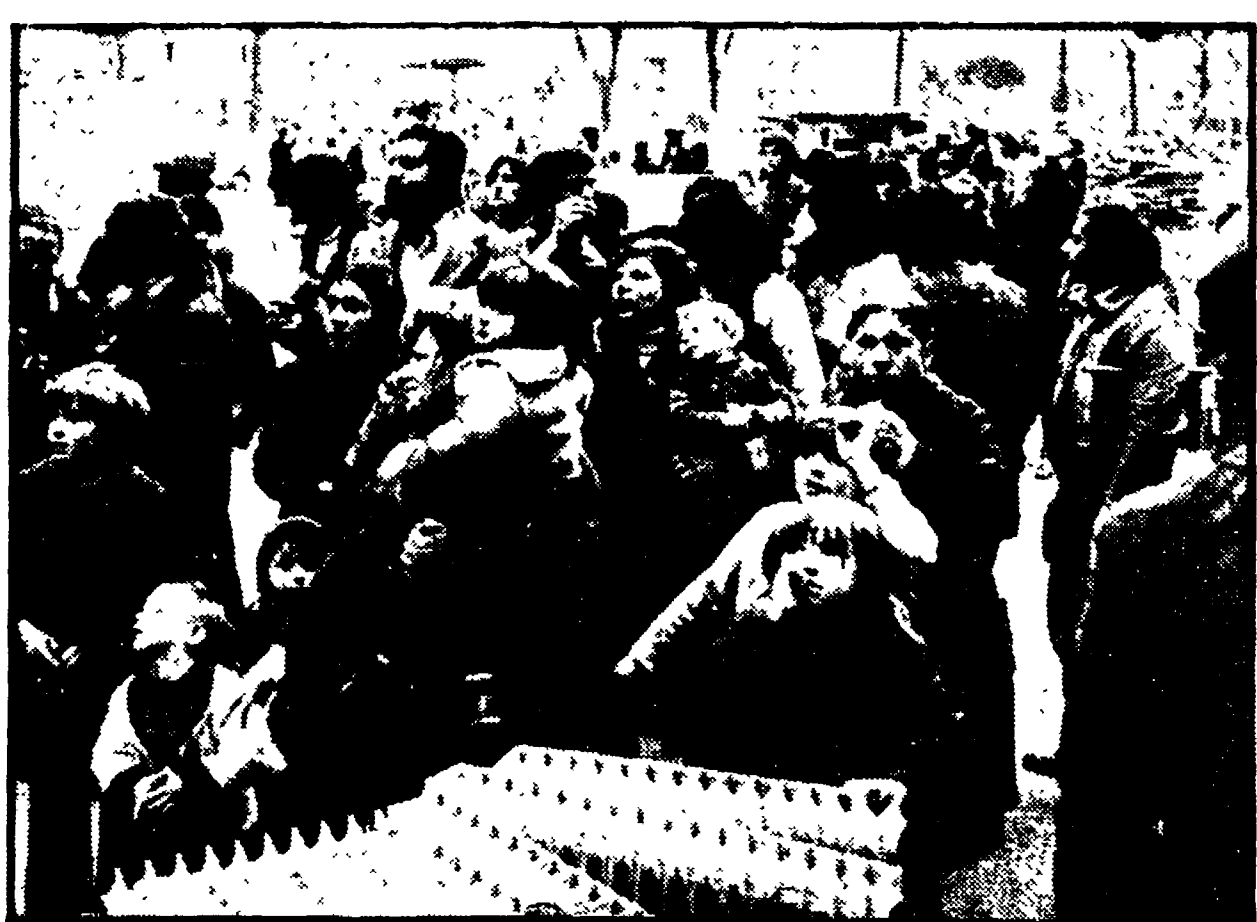
Nelle foto: due aspetti dell'occupazione dello stabile in via Campanile a Pianura

Attimi di tensione tra gli occupanti ed alcuni lavoratori del cantiere, istigati dal padrone - Il problema della casa al centro dell'iniziativa del Consiglio di quartiere - La piaga dell'abusivismo