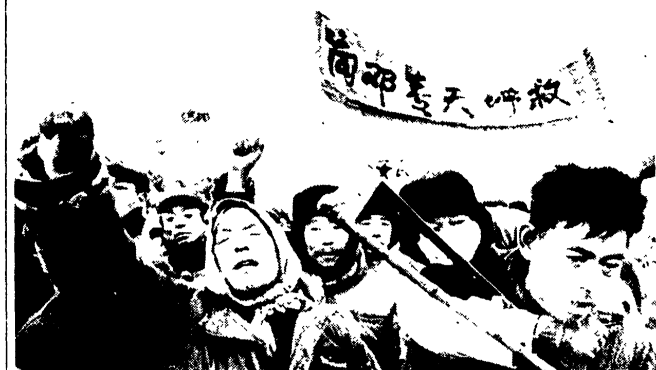
PECHINO — Un aspetto della manifestazione svoltasi nella Tiananmen.

Si rivolgono a Deng Xiaoping un centinaio di persone «rimaste senza mezzi di sussistenza dall'epoca di Lin Biao e dei quattro» Verso una soluzione per Macao? - Nuovi incidenti col Vietnam