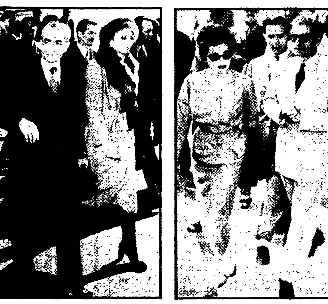
Le due fughe dello scià: a sinistra, la partenza ieri con Farah Diba da Teheran; a destra, l'arrivo a Roma con Soraya nell'agosto 1953, alla vigilia del colpo di Stato ordito dai suoi generali