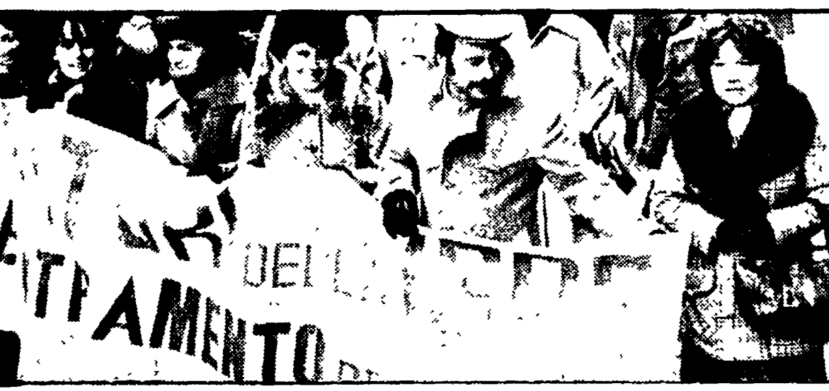
Uno scorcio della manifestazione di ieri a Empoli

Nascono e crescono tantissime «catene» sparse qua e là - Nella zona, una perdita secca di 450 lavoratori, soprattutto donne, negli ultimi 3 anni