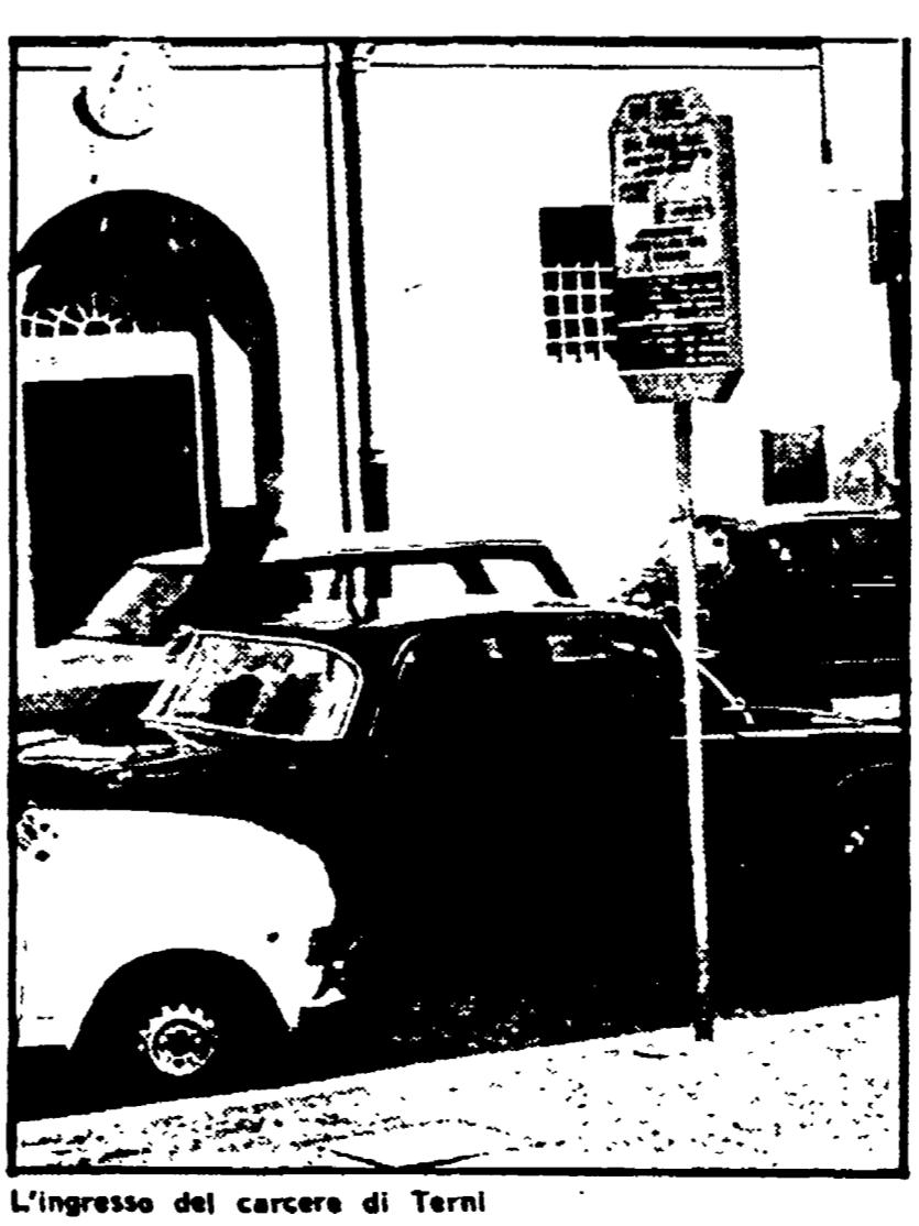
L'ingresso del carcere di Terni

Non ultime righe il Fondo mondiale per la natura rivolge un esplicito invito alle magistrature anconetane ad intervenire per accertare le responsabilità, per rimuovere le cause che provocano la preoccupante escalation di malattie ambientali nella città capoluogo di regione.