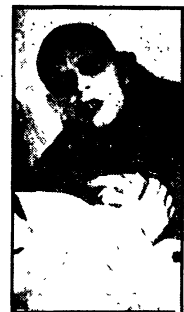
Il Nosferatu di Herzog