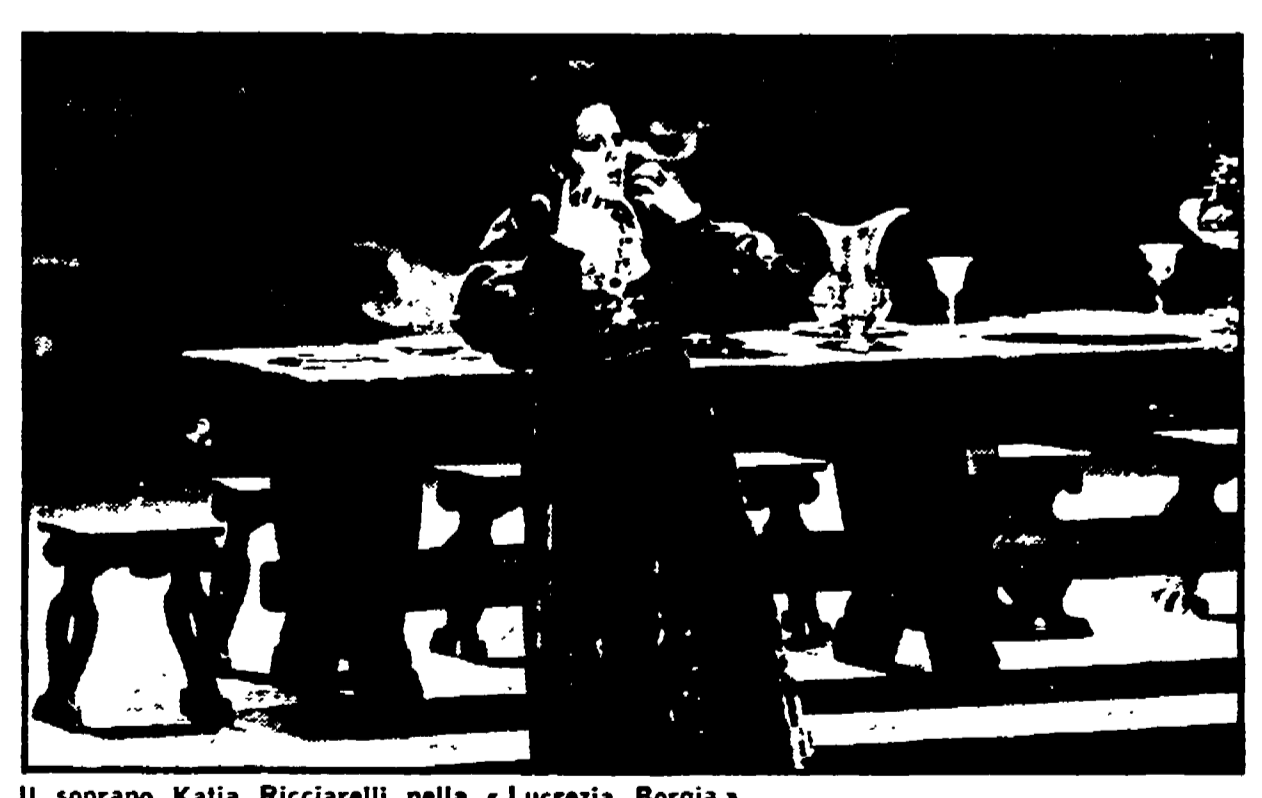
Il soprano Kalta Ricciarelli nella «Lucrezia Borgia»