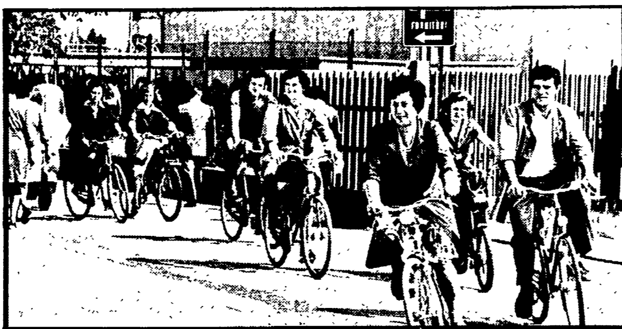
L'uscita degli operai della Zanussi

Una produzione tutta rivolta all'esportazione - Un sindacato forte che ha gestito la mobilità - L'esempio del legno