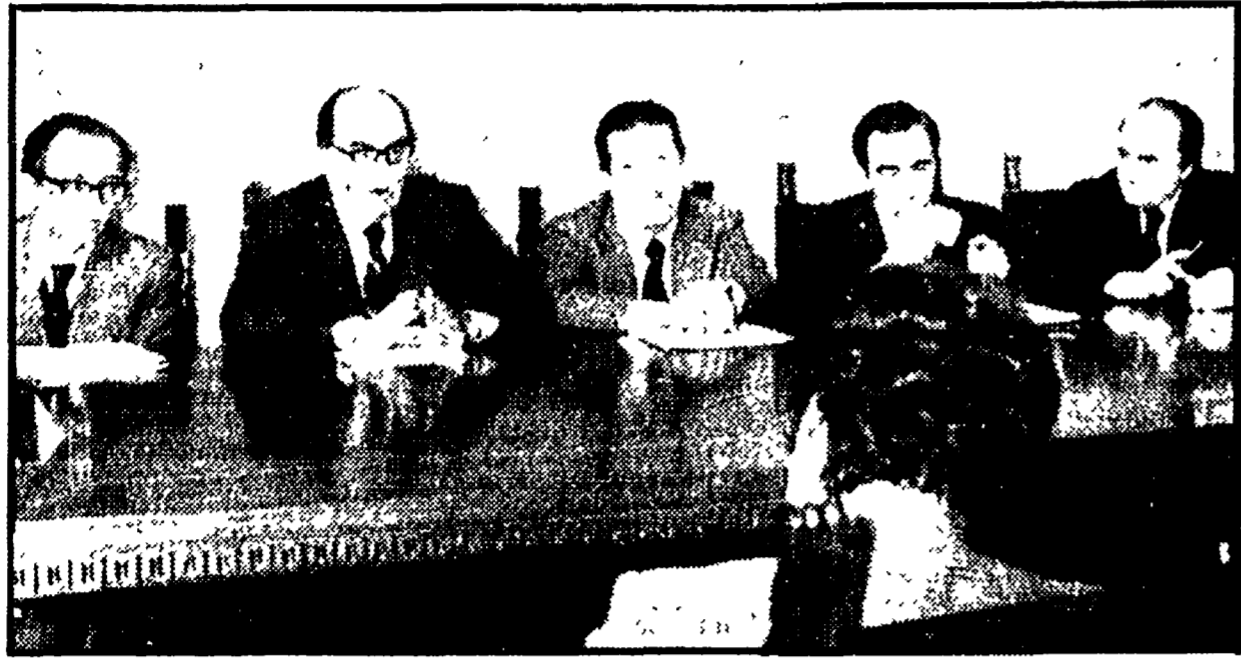
Un momento della conferenza stampa di ieri: da sinistra i dott. Tortora e Potenza dell'Ufficio legislativo di Palazzo Chigi, l'on. Franco Evangelisti, il presidente del CONI, Carraro, e il prof. Zotta dell'Ufficio legislativo della Camera dei deputati.