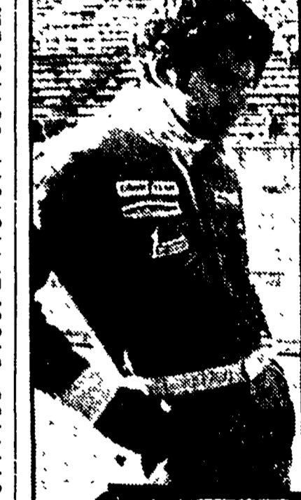
● SCHECKTER l'uomo di punta della Ferrari

KYALAMI - Dopo le prove libere della settimana scorsa sul circuito di Kyalami, dove sabato si disputerà il G.P. del Sudafrica, il primo round del campionato di Formula 1, ci sono stati alcuni giorni di silenzio. Da oggi, però, la vacanza è finita, e fino al giorno della gara non ci sarà praticamente più tregua. Stamani, infatti, riprendono le prove libere, mentre domani e dopo domani si faranno quelle ufficiali.