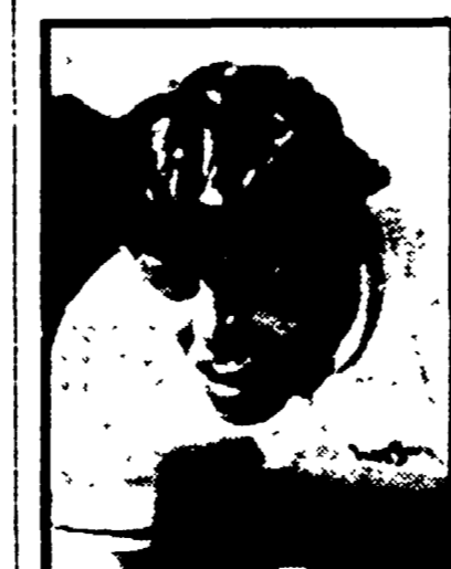
● KNUDSEN: la prima mano a tic-tac è stata sua

Questo di Pesciolini è il cilindro di un intero paese, è una manifestazione voluta e sostenuta dagli abitanti della zona che vogliono rispettare una bella tradizione, è un atto d'amore verso lo sport scandinavo. Gli altri volte la Coppa Sabatini è stata annullata per mancanza di sensibilita, e speriamo che in questi giorni prevenga il buonasera.