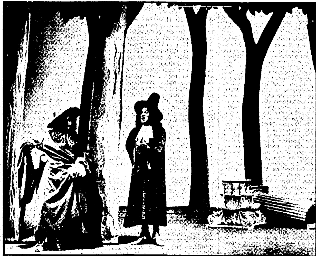
Un momento del «Don Giovanni» di Molière

Tempo di vacche magre e il teatro, come è stato da sempre, conosce dopo le folle carnevalesche il tempo dell'espiazione.