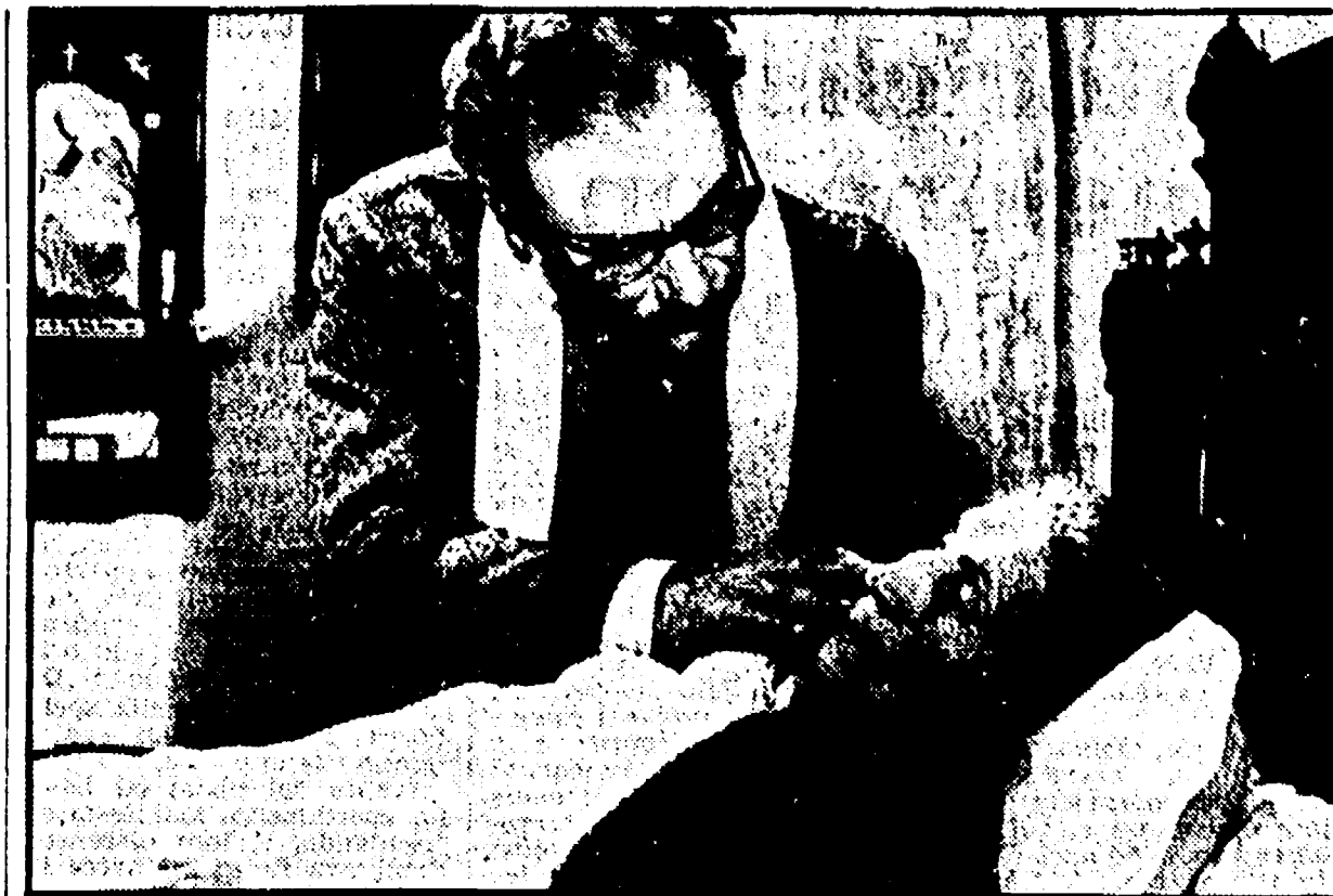
Un fotogramma del film di F. Rosi «Cristo si è fermato ad Eboli» con G. M. Volonté

Dopo le licenze e i travestimenti del Carnevale, è norma che la Quaresima riporti pentimenti e mortificazioni, anche se ormai da tempo sia sempre più difficile distinguere, latamente, tra giorni fasti e nefasti.