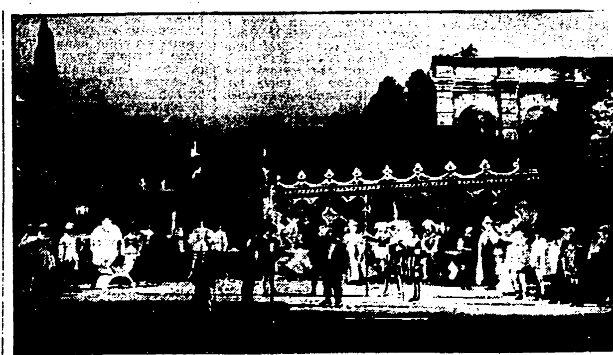
Una scena dal «Rigoletto» di Giuseppe Verdi