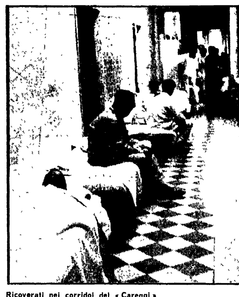
Ricoverati nei corridoi del «Careggi»