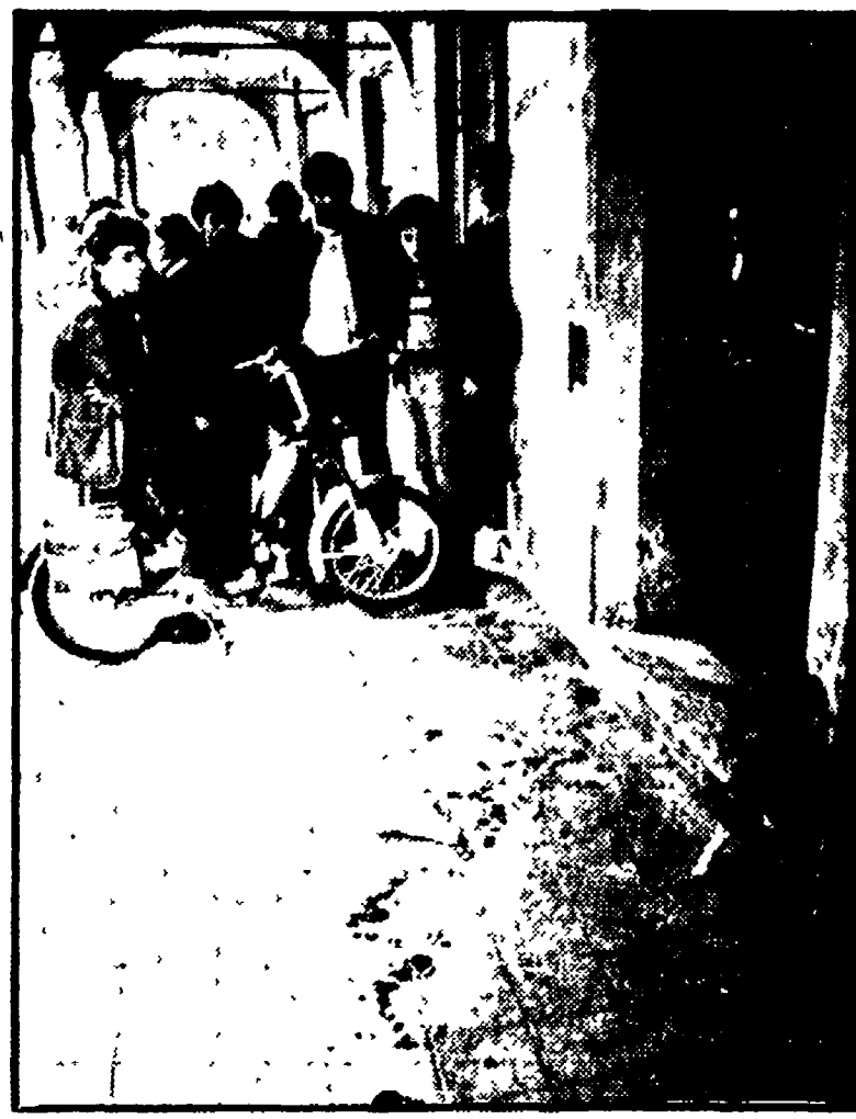
del « movimento » nei confronti del problema di fondo: quello della democrazia.

La città aveva visto crescere un fenomeno nuovo, che andava ben oltre i propri confini amministrativi.