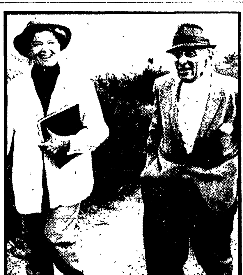
Girano insieme l'antica amicizia che non si smentisce quella tra Katharine Hepburn e George Cukor. La settantenne ma vispa attrice sta girando con l'ottuagenario regista il film « The corn is green ». E' il decimo che fanno insieme: la « collaborazione » nacque 47 anni fa, nel lontano 1932. Nella foto, la Hepburn e Cukor a passeggio per le campagne del North Wales in una pausa delle riprese.

stico e quotidiano. Ma ciò, oltre a notare l'irriverenza dell'insegnamento, conduce solo a constatare che il consumo passivo delle immagini nella vita ignoranza del linguaggio fonda il potere dei « persuasori occulti » o « principi della notte cinetica televisiva ».