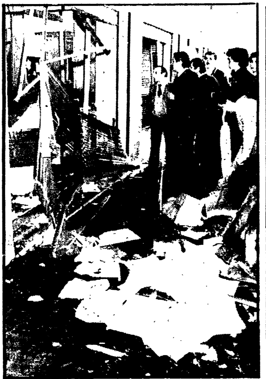
FIRENZE - I danni all'Istituto del CNR