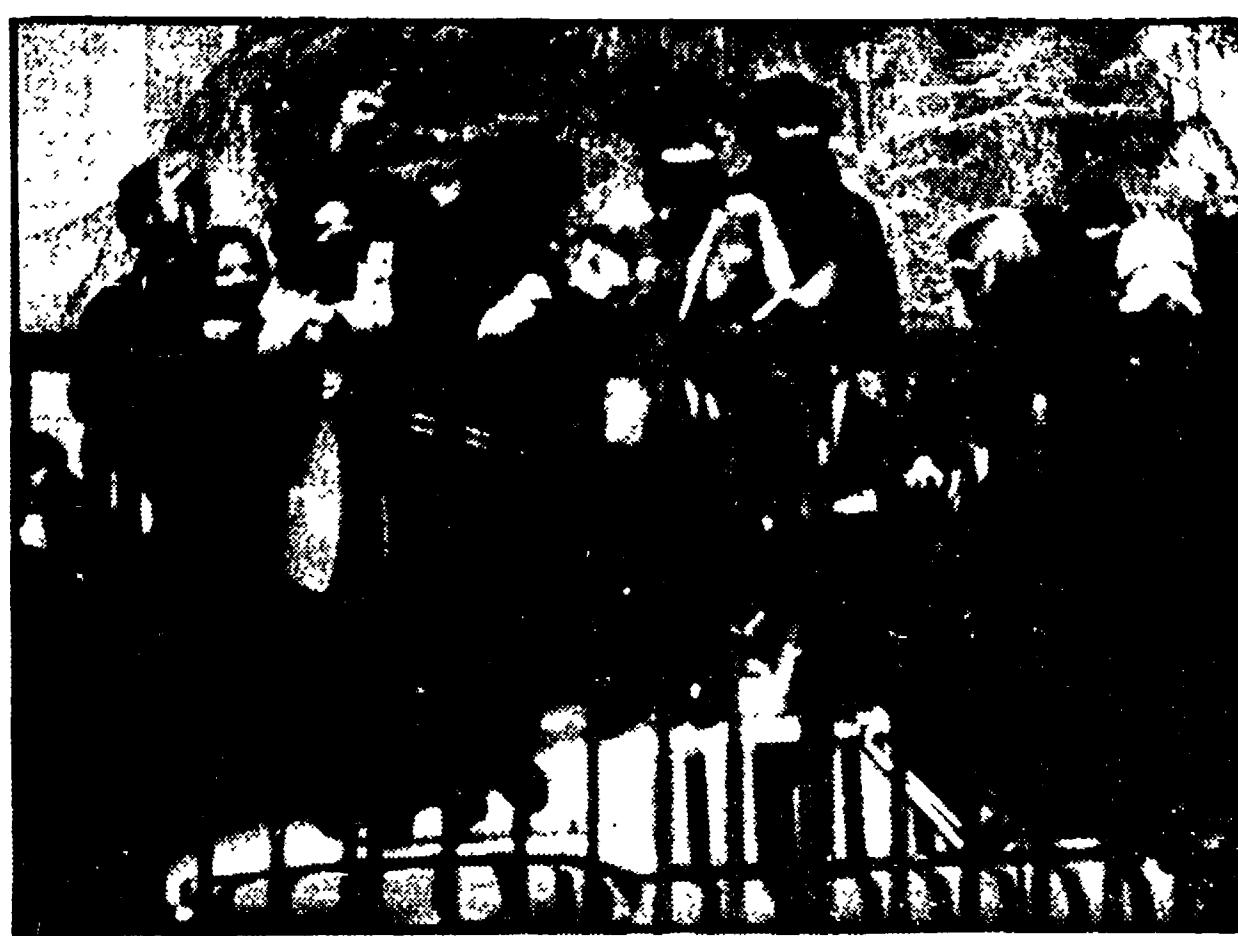
Autonomi all'università di Roma