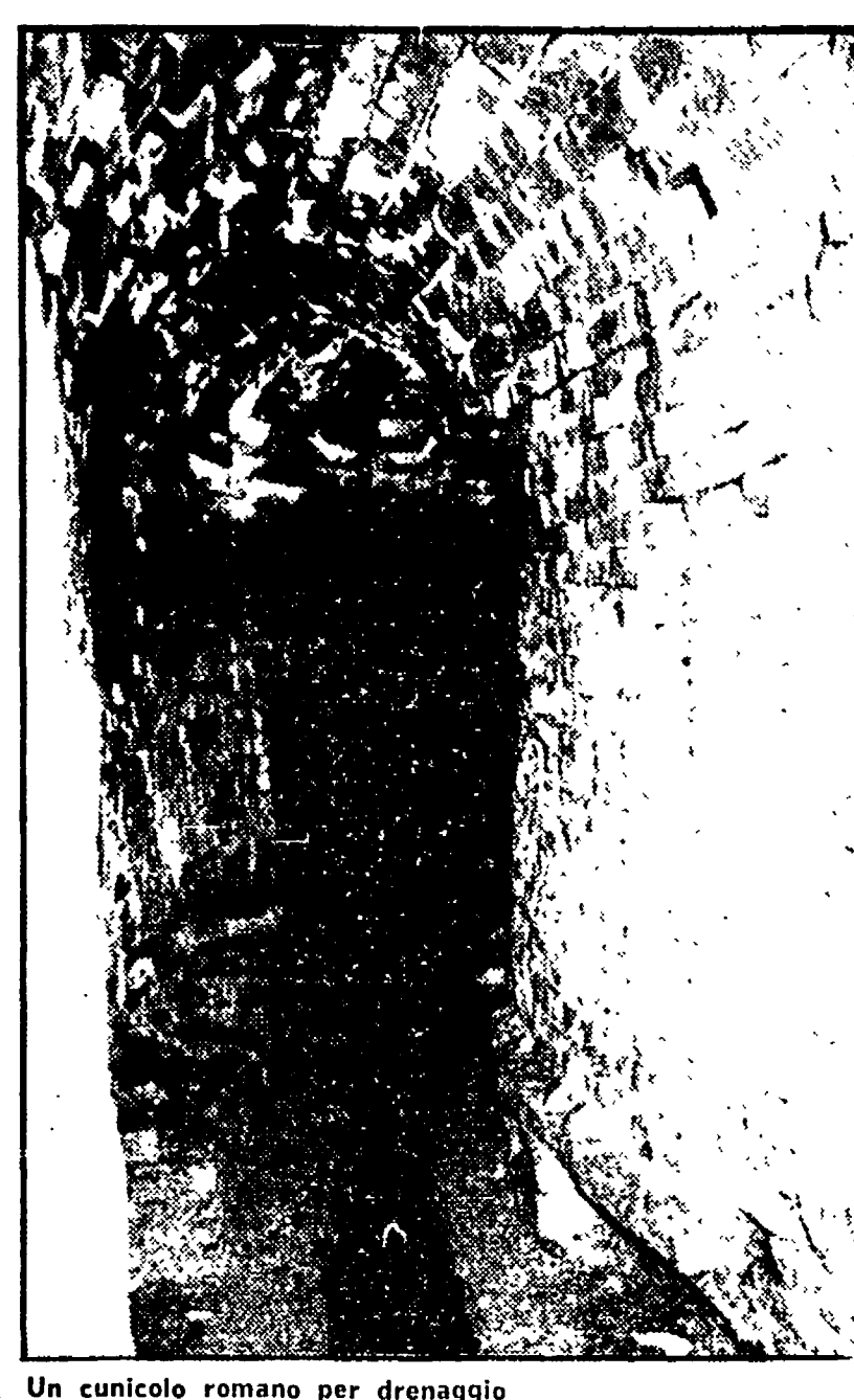
Un cunicolo romano per drenaggio

Il ritrovamento durante i lavori di consolidamento a Palazzo Azzolino - Un percorso che pareva non finisse mai - Si potranno meglio combattere i vari fenomeni franosi