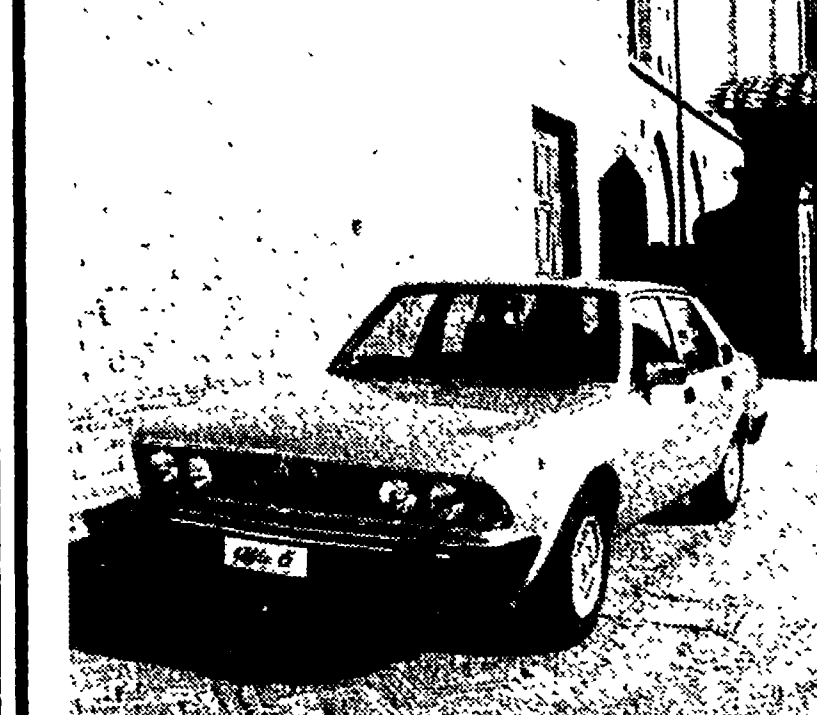
Nonostante la tradizionale linea, la nuova berlina Alfa Romeo dà una netta impressione di potenza.

Le eccezionali caratteristiche della nuova « ammiraglia » - Sono ben sessantacinque i dispositivi di servizio e sono tutti compresi nel prezzo - Commercializzata anche una versione della Giulietta con motore di 1,8 litri