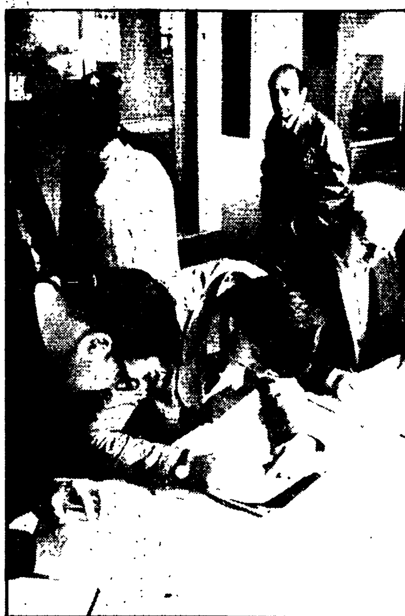
La firma dell'atto di requisizione delle case