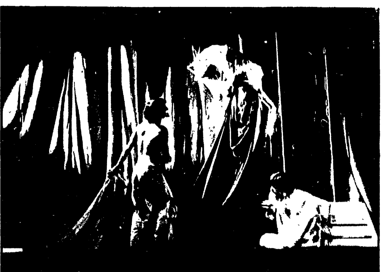
«Capitano Ulisse» di Alberto Savinio nell'allestimento del gruppo di Bologna

Settimana movimentata per il teatro con la conclusione della lunga rassegna femminile di satira lunare all'IS.M.S. di Rifredi e con l'inizio della prestigiosa Rassegna del Teatro Stabile, quavene » di T. Malick, con M. Sheen, S. Spack (venerdì 27).