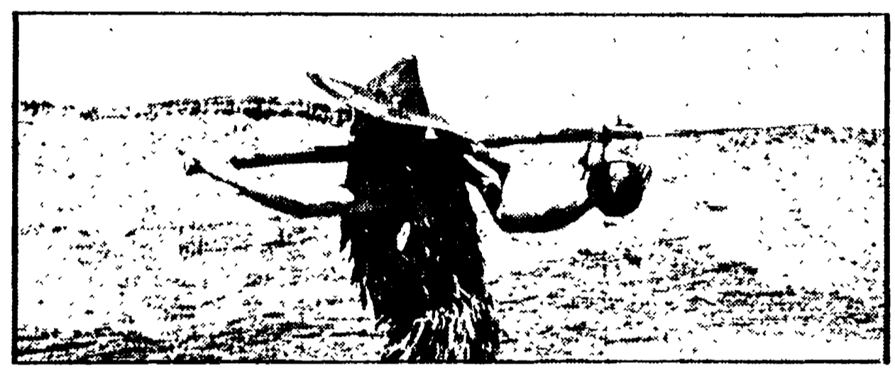
Un'inquadratura da « Edipo re » di Pier Paolo Pasolini

Distillati con il contagocce per non abituare il pubblico ai (pochi) prodotti decenti di questa stagione, arrivano, in mezzo ad unanimità e collegiali in pannoestasi, gli ultimi film d'autore che ancora punteggiano il panorama. Tra questi l'acclamato Opening night (La sera della prima) dell'americano Cassavetes solo recentemente « scoperto » dalla distribuzione italiana nonostante la sua ventennale attività (Shadows è del '58). Presa nel dramma tra vita e teatro è la straordinaria interprete Gena Rowlands, moglie e collaboratrice di Cassavetes.