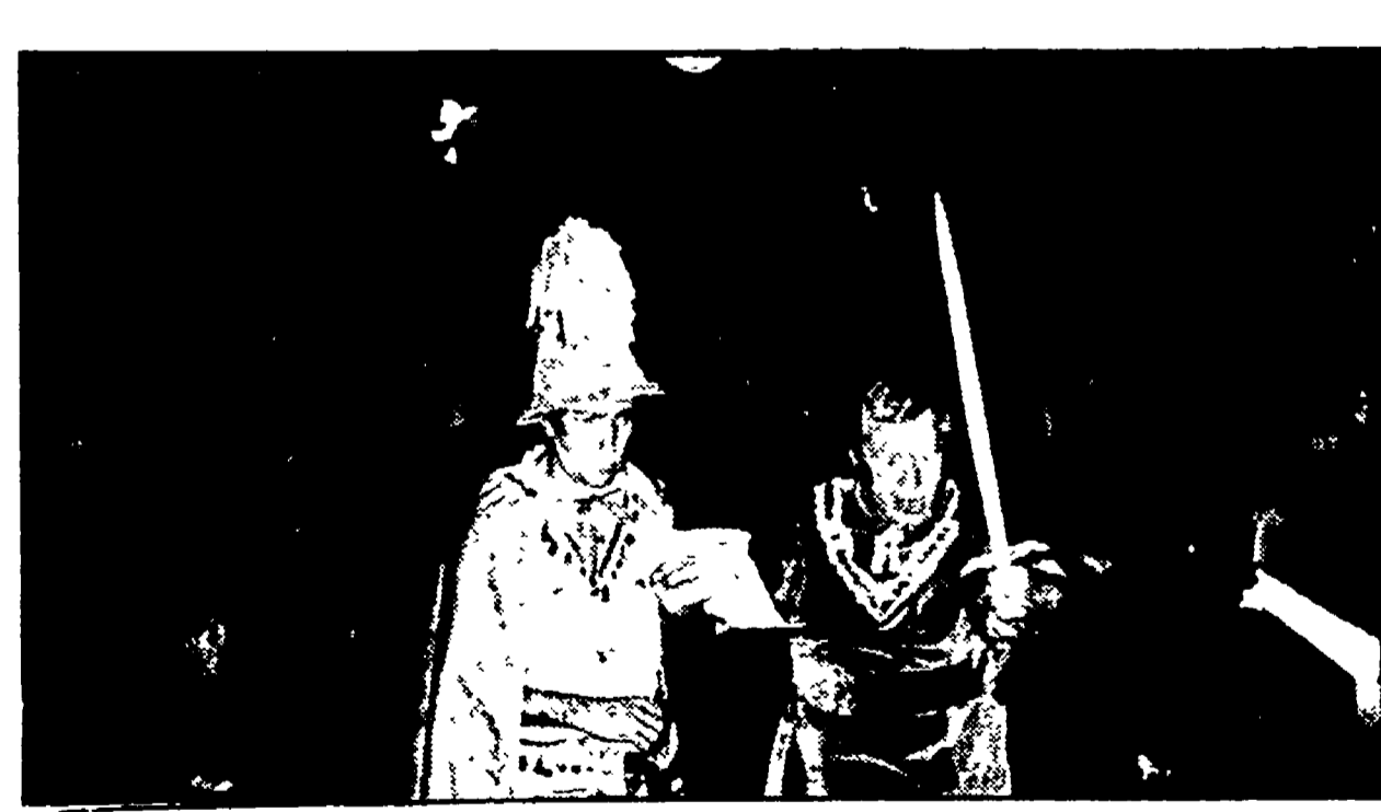
Una scena di Pia dei Tolomei realizzata da una delle compagnie dei «Maggi toscani»

Si inaugura proprio in questa settimana il 42. Maggio Musicale Fiorentino. Per questo avvenimento di grande prestigio internazionale è stato scelto uno dei capolavori del teatro musicale del Novecento, il Wozzeck di Alban Berg, che torna sulle scene fiorentine dopo la fortunata edizione del 1963, ripresa anche durante il Maggio Espressionista del 1964. Anche allora, come nell'edizione che inaugurerà il festival, era sul podio Bruno Bartoletti.