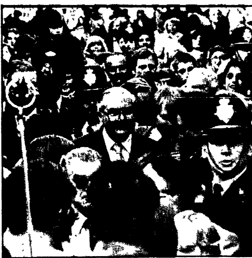
Gli assalti ideologici contro gli « eccessi di socialismo » già si stemperano nelle cautele del nuovo premier La polemica contro lo « statalismo » e il rapporto con i sindacati La riflessione tra i laburisti