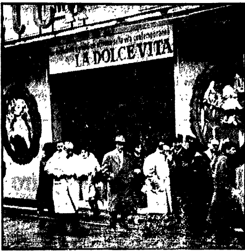
Anni Sessanta: l'ingresso di un cinema dove «La dolce vita» è, nell'altra foto, il bagno usato per «Cleopatra», esposto alla mostra romana