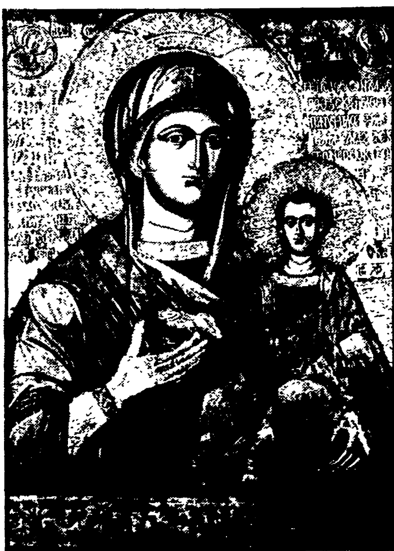
La Madonna Odigitria, icona della città di Nesebar (1342); nella foto a fianco, un particolare