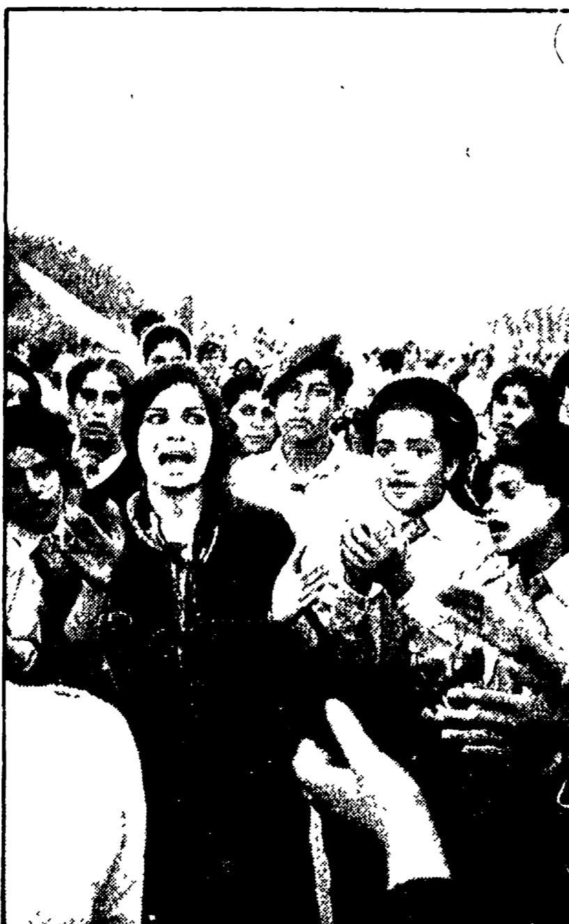
Giovani palestinesi durante una manifestazione per la via di Beirut.