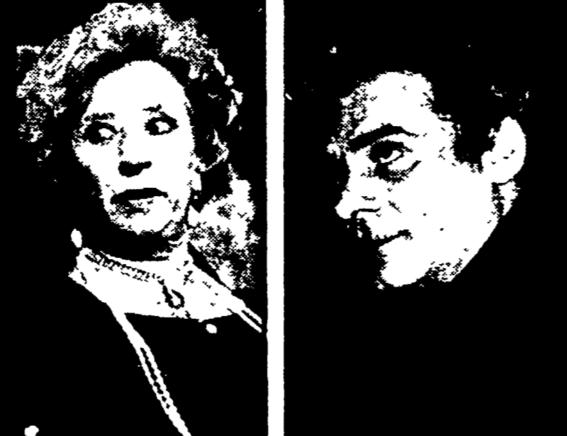
Lino Volontè e Gian Maria Volontè sono tra gli interpreti de «L'Idiota» di Dostoevskij, in onda sulla Rete due.