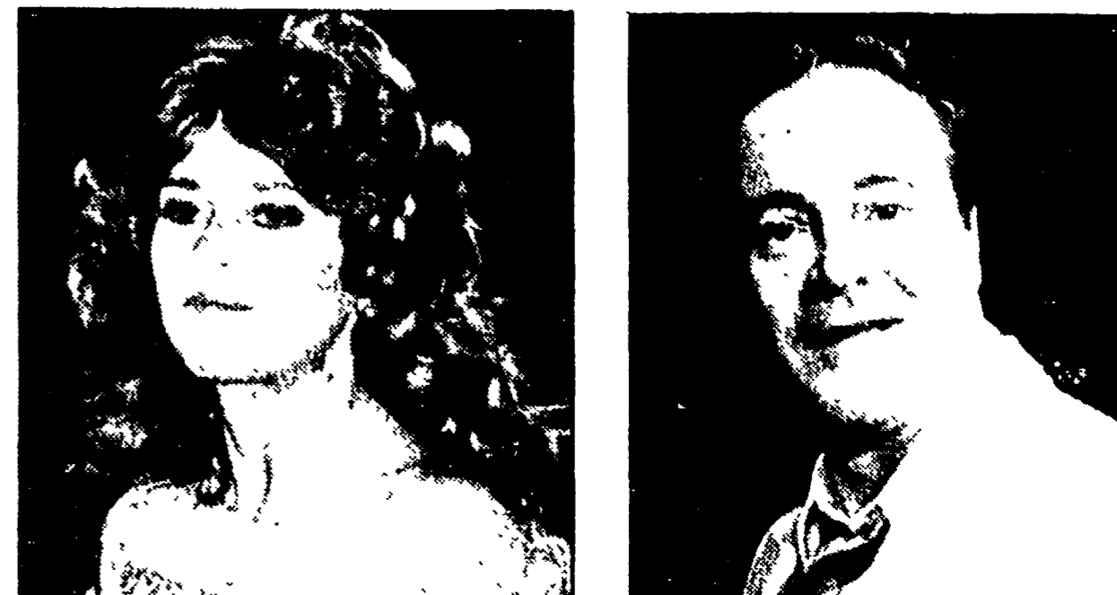
Jane Fonda e Jack Lemmon tra gli interpreti del film di James Bridges «La sindrome cinese».

spesso, le traballanti immagini, ma contribuiscono solo a rilevare la pochezza, aggravata dalla scarsa espressività degli attori protagonisti... Aggeo Savioli