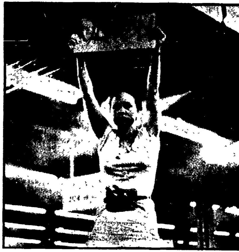
Sally Field in «Norma Rae». L'attrice è in lizza per un premio per la sua interpretazione nel film di Martin Ritt