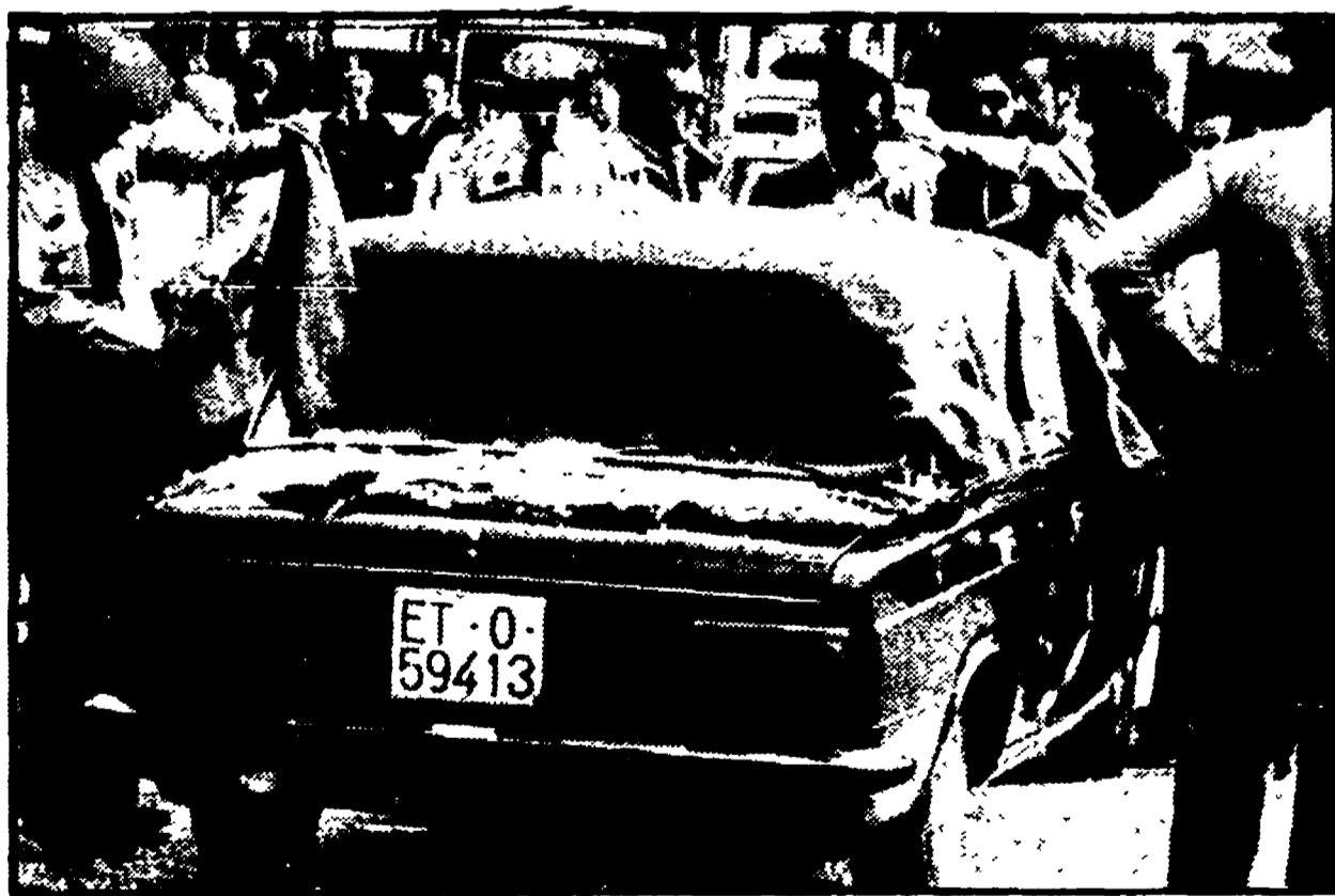
MADRID — L'auto con i quattro morti a bordo dopo l'agguato dei terroristi

Morto anche un soldato - Scontro a fuoco a Siviglia: uccisi un commissario e un terrorista del GRAPO - La polizia spara su un'auto in fuga: un morto