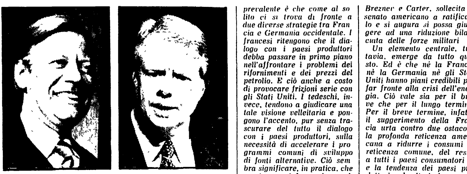
Helmut Schmidt e Jimmy Carter

Ma nessuno crede all'improvvisa «luna di miele» tra Bonn e Washington