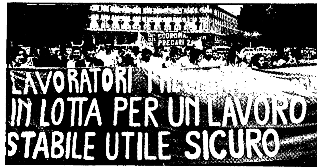
La manifestazione dei giovani di Ieri mattina

All'incontro, che dovrà svolgersi entro giugno, parteciperanno rappresentanti del Cipe, della Regione e dei sindacati unitari - Il ministero si è impegnato a prorogare tutti i contratti - Al Lazio da 30 miliardi richiesti a 13