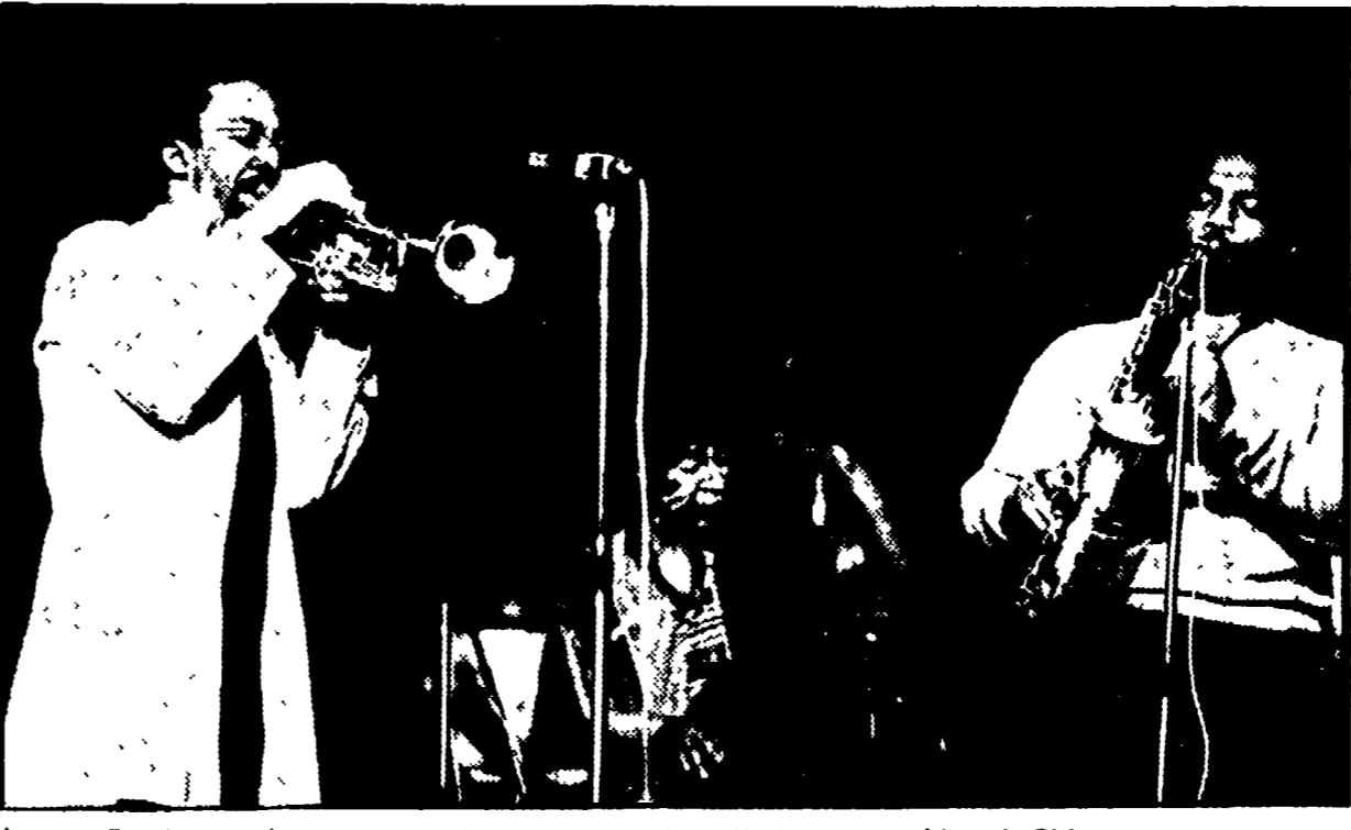
Lester Bowie (a sinistra) con due componenti dell'Art Ensemble of Chicago