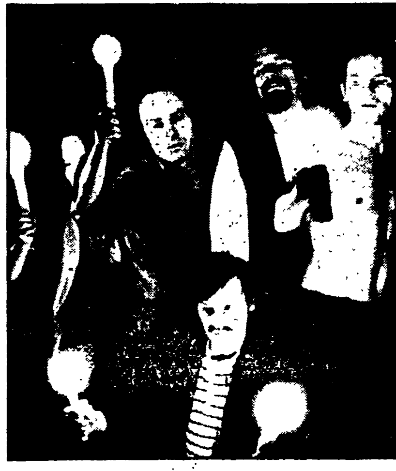
Apokalipsis di Grotowski in scena a Pontedera